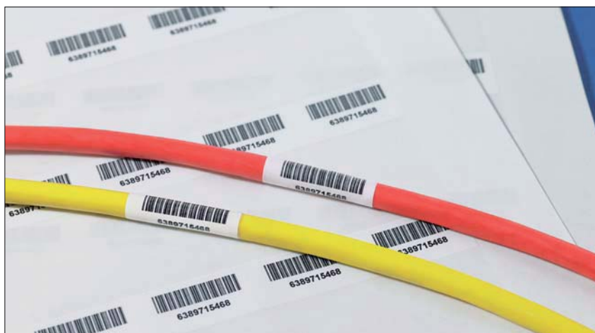
La protection transparente offre une identification durable.