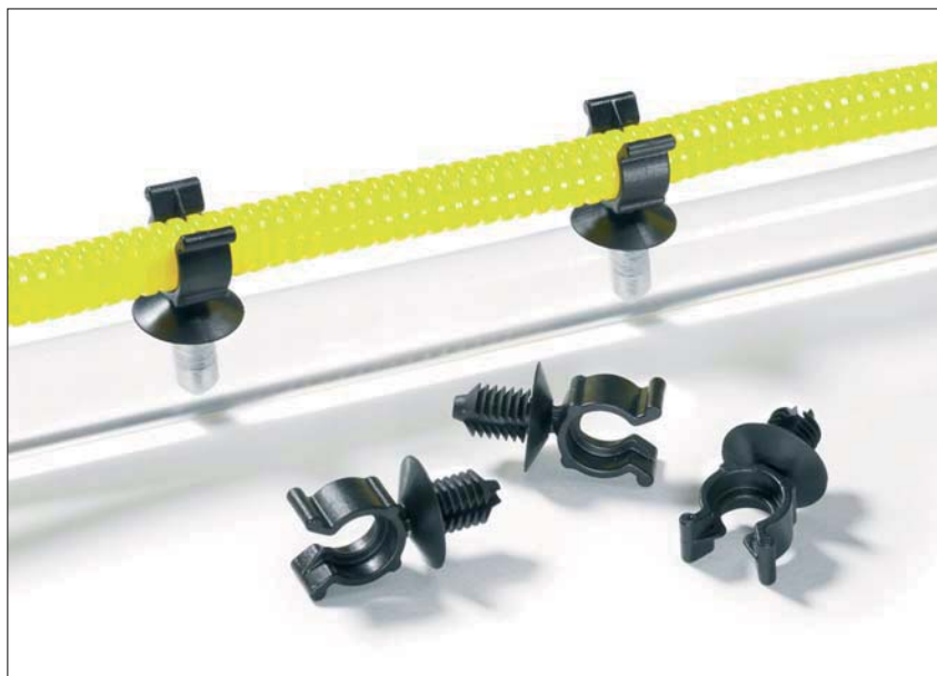
La gaine est clipsée dans l'agrafe CTC et fermement maintenue.

Les clips CTC sont utilisés dans l'automobile, la fabrication des faisceaux, l'industrie électrique et partout où les gaines annelées doivent être fixées rapidement et solidement.