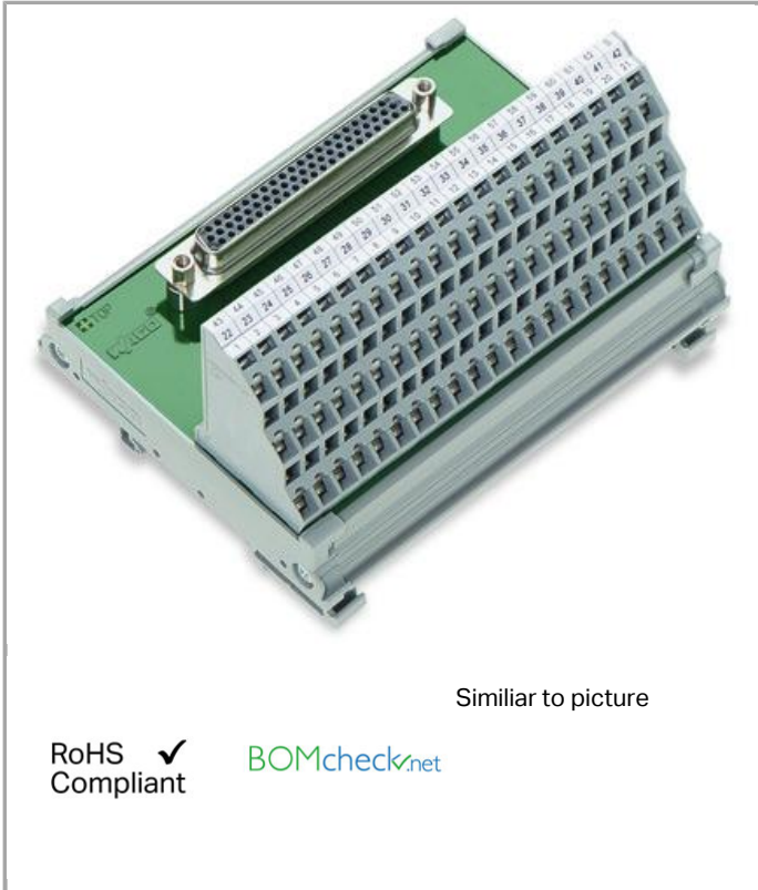
Similar to picture