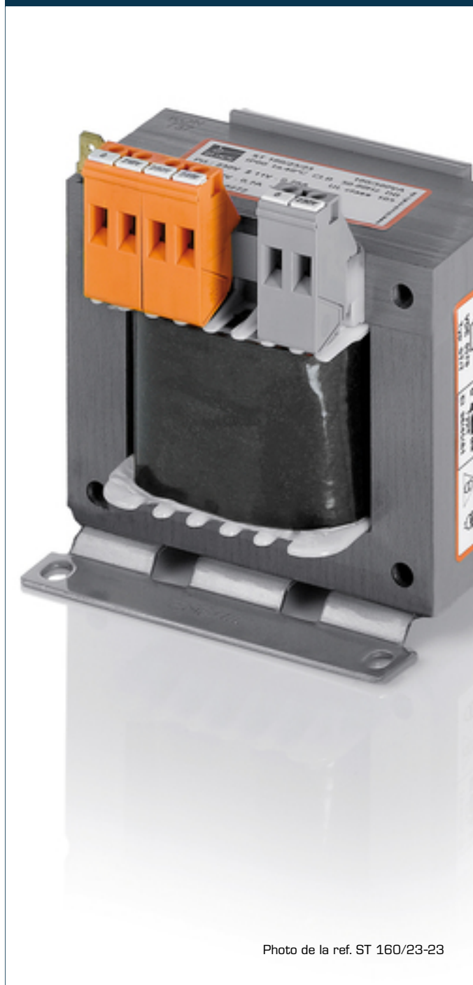
Photo de la ref. ST 160/23-23