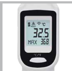
Afficheur rétroéclairé à cristaux liquides