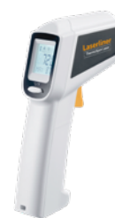
ThermoSpot Laser + piles

Dimensions de l'emballage (L x H x P) 190 x 310 x 58 mm