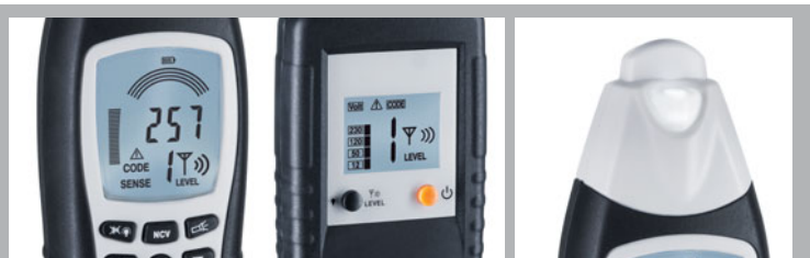
Écrans d'affichage clairs et éclairés