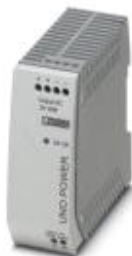
Alimentation UNO à découpage primaire pour montage sur profilé, entrée : monophasée, sortie : 5 V DC/40 W

Remarque : les données indiquées ici sont tirées du catalogue en ligne. Vous trouverez toutes les informations et données dans la documentation utilisateur. Les conditions générales d'utilisation pour les téléchargements sur Internet sont applicables. ( http://phoenixcontact.fr/download )