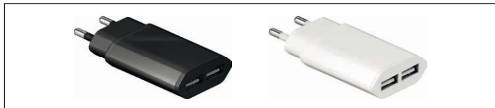
Fig.5: Chargeurs de voyage

Ce produit est un chargeur destiné à recharger et faire fonctionner des appareils mobiles par prise spécifique du modèle à USB. Il convertit la tension alternative à 5 volts basse tension.