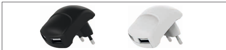
Fig.5: Chargeurs de voyage

Ce produit est un chargeur destiné à recharger et faire fonctionner des appareils mobiles par prise spécifique du modèle à USB. Il convertit la tension alternative à 5 volts basse tension.