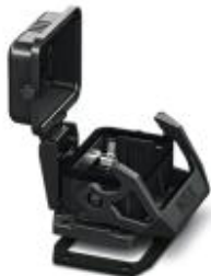
Embase HEAVYCONNEC EVO en plastique, B6, avec verrouillage longitudinal, hauteur 30,5 mm, avec joint plat, avec couvercle de protection

Remarque : les données indiquées ici sont tirées du catalogue en ligne. Vous trouverez toutes les informations et données dans la documentation utilisateur. Les conditions générales d'utilisation pour les téléchargements sur Internet sont applicables. ( http://phoenixcontact.fr/download )