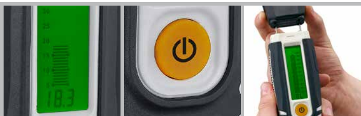
Grand afficheur bien lisible à cristaux liquides