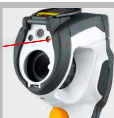
Laser de visée pour la visée