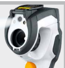
Éclairage de l'objet par DEL