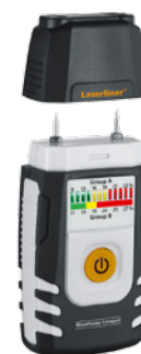
Capuchon de protection à fonction de test automatique