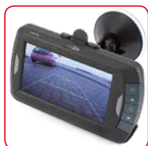
avec l'option de l'écran de directive

Aucune connexion filaire entre la caméra et l'écran. La caméra transmet le signal vidéo à l'écran.