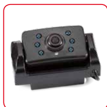
Comprend une caméra

Systeme de caméra numérique arrière sans fil avec écran TFT 4,3 pouces