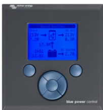
Tableau de commande Blue Power

Une solution pratique et bon marché pour une surveillance à distance, avec un bouton rotatif pour configurer les niveaux de Power Control et Power Assist.