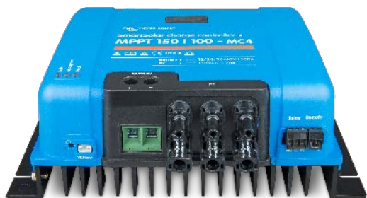
Contrôleur de charge solaire MPPT 150/100 MC4 sans écran