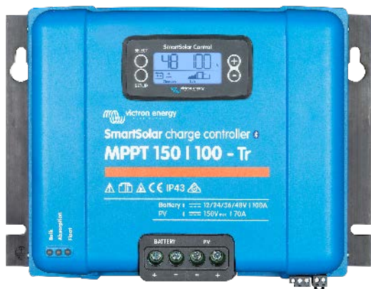
Contrôleur de charge solaire MPPT 150/100-Tr avec un écran enfichable