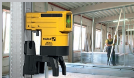
Système magnétique puissant avec aimant aux terres rares