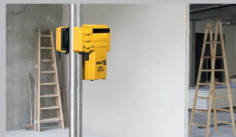
Dispositif de serrage intégré