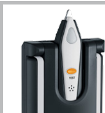
Logement pour le récepteur