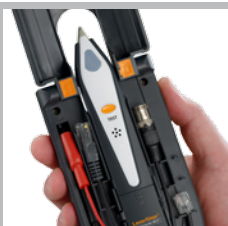
Émetteur avec adaptateur intégré