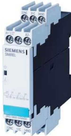
Figure à titre d'exemple

!!! Produit en fin de vie !! Le successeur recommandé est 3RQ2000-1CW01. Borne-relais dans le boîtier industriel 3 inverseurs dorés durs large plage de tension 24 V à 240 V CA/CC borne à vis