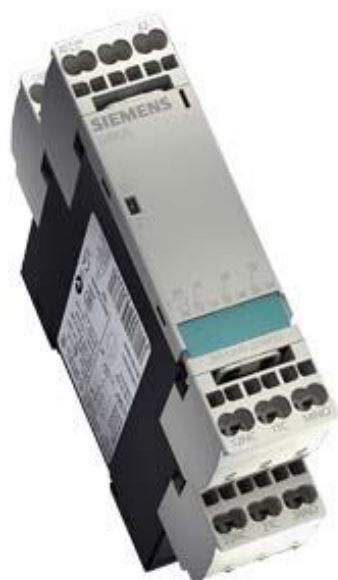
Figure à titre d'exemple

!!! Produit en fin de vie !! Le successeur recommandé est 3RQ2000-2CW01. Borne-relais dans le boîtier industriel 3 inverseurs dorés durs multi-tension 24 V CA/CC et 110-120 V borne à ressort