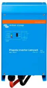
Phoenix Inverter Compact 24/1600

Les possibilités des convertisseurs puissants en parallèle sont réellement surprenantes. Pour en savoir plus sur les batteries, les configurations possibles et des exemples de systèmes complets, veuillez consulter notre livre « Energie Sans Limites » (disponible gratuitement chez Victron Energy et en téléchargement sur www.victronenergy.com ).