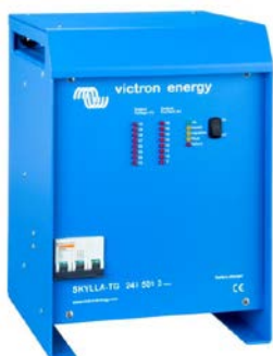
Skylla TG 24 50 3 phase

Pour tout savoir sur les batteries, les configurations possibles et des exemples de systèmes complets, demandez notre livre gratuit "Energie Sans Limites" également disponible sur www.victronenergy.com .