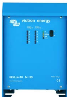
Skylla TG 24 50