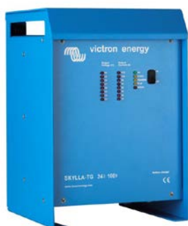
Skylla TG 24 100