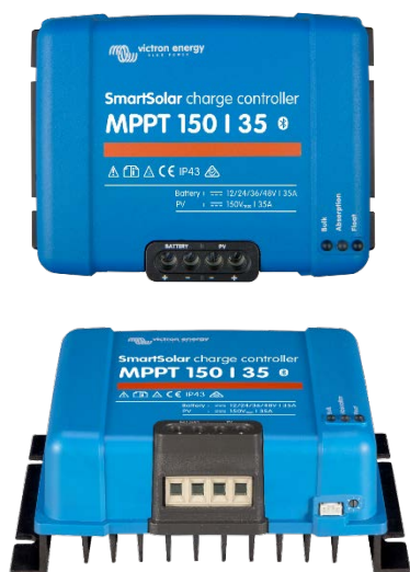
Contrôleur de charge SmartSolar MPPT 150/35