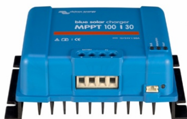
Contrôleur de charge solaire MPPT 100/30