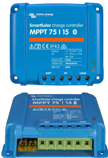
Contrôleur de charge SmartSolar MPPT 75/15