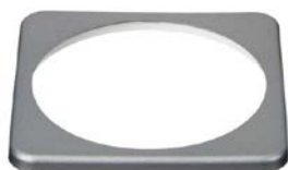
Cadran carré BMV