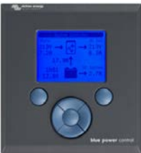
Tableau de commande Blue Power

Une solution pratique et bon marché pour une surveillance à distance, avec un bouton rotatif pour configurer les niveaux de PowerControl et PowerAssist.