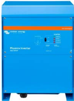
Phoenix Inverter 24/3000