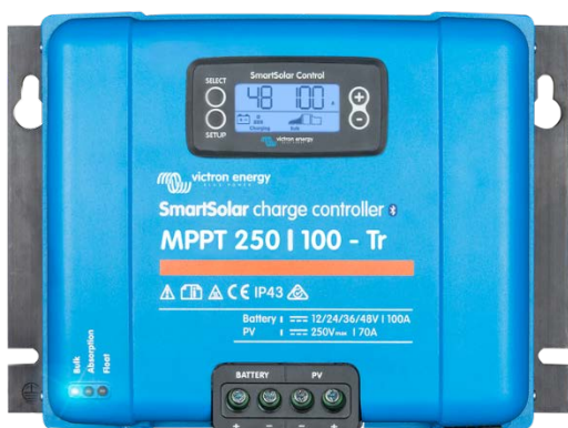
Contrôleur de charge SmartSolar MPPT 250/100-Tr avec un écran enfichable