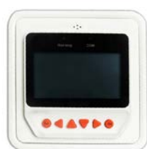
Tableau de commande à distance du BlueSolar Pro