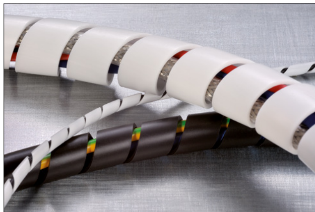
Frettes spiralées SBPEFR, avec retardateur de flamme.