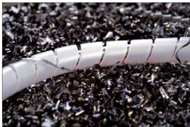
La frette spiralée SBPA offre une excellente protection contre l'abrasion.