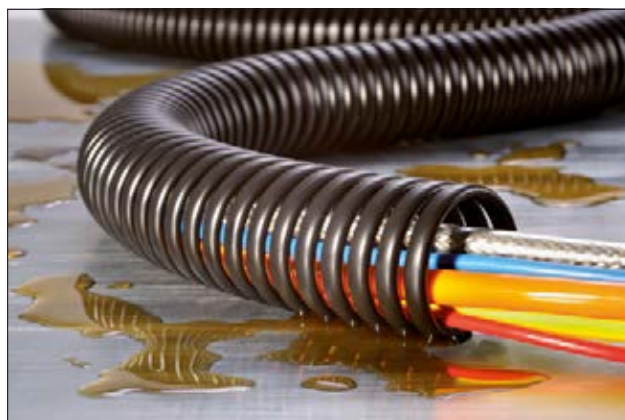
La frette spiralée SPS offre une bonne protection contre les huiles.