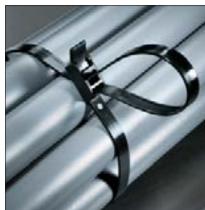
Collier SpeedyTie en application.