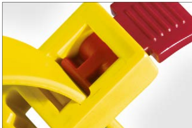
SpeedyTie - système de ré-ouverture breveté, simple et rapide.

Une version de couleur jaune, avec languette rouge, rend le SpeedyTie facilement repérable et limite ainsi les risques d'oubli ou de perte. La version noire, plus sobre, est recommandée pour des applications en extérieur comme dans l'événementiel, lors de concerts ou décors de théâtre.