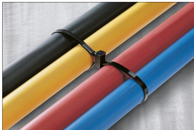
Collier de la série DH en application, pour un routage en parallèle.