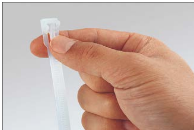
Réouverture du collier REL d'une simple pression, avec le doigt.