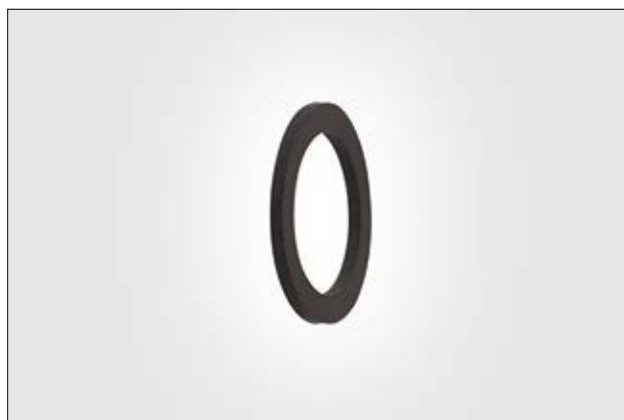
Joint en chloroprène HelaGuard AWS.