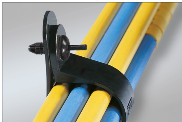
Rivet TY8P1, en application.