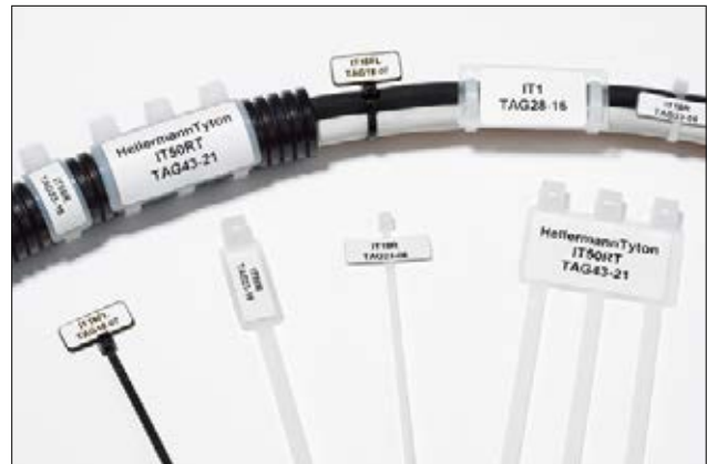
Identification de colliers et de plaquettes.