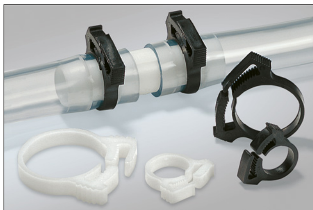
Éléments de fixation de la série SNP, en application.