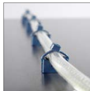
Embases détectables de la série MCKR, en application, avec des colliers de la série MCT.