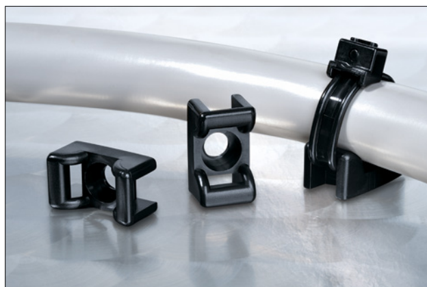
Embases de la série KR en application.