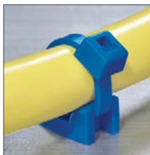
Embase détectable KR6G5-E/TFE.