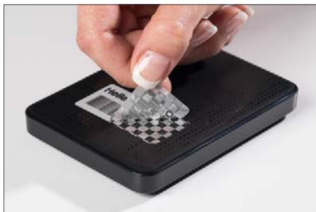
Signe d'invulnérabilité très visible.