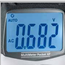
Grand écran d'affichage à cristaux liquides rétroéclairé