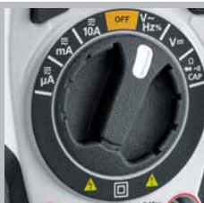
Commutateur rotatif facile à utiliser