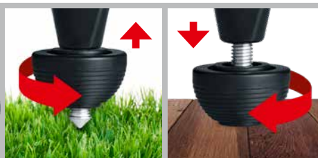
Remplacement des pointes universelles