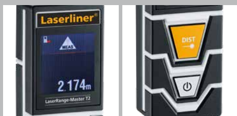
Afficheur couleur à cristaux liquides rétroéclairé

* Se reporter au mode d'emploi pour les précisions relatives au secteur