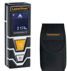
LaserRange-Master T2 inclus sacoché + piles (2 x 1,5 V Typ AAA)

Dimensions de l'emballage (L x H x P) 113 x 236 x 64 mm