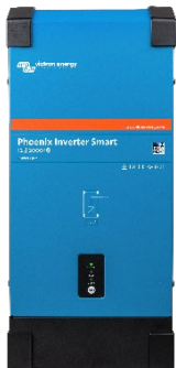
Convertisseur Phoenix Smart 12/2000