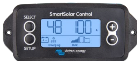
Écran à brancher SmartSolar

Retirez simplement le joint en caoutchouc qui protège la prise sur le devant du contrôleur puis insérez l'écran.