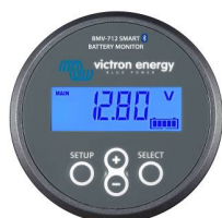
Détection Bluetooth : Contrôleur de batterie BMV-712 Smart