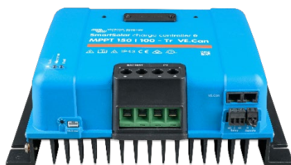
Contrôleur de charge SmartSolar MPPT 150/100-Tr VE.Can sans écran