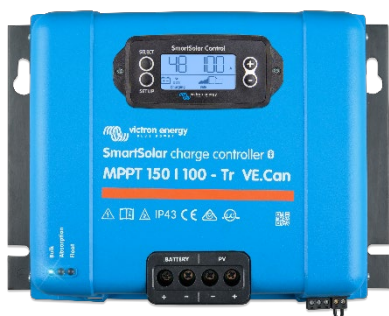
Contrôleur de charge SmartSolar MPPT 150/100-Tr VE.Can avec écran à brancher en option