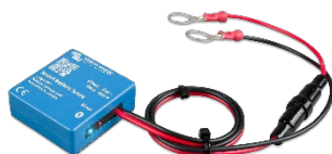
Détection Bluetooth : Sonde Smart Battery Sense