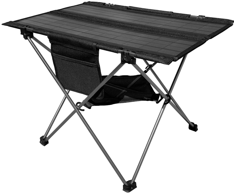
Table de camping solaire pliable 20W TX-251