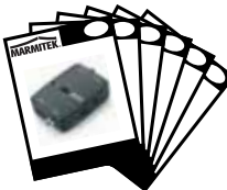
1x User manual English, Deutsch, Français, Español, Italiano, Nederlands