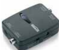
1x Audio Converter