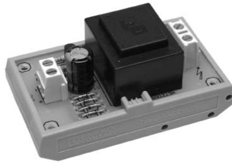
Anwendungsbeispiel: Modul-Netzteil, eingebaut in ein Hutschienengehäuse.

H-Tronic GmbH, Industriegebiet Dienhof 11, D-92240 Hirschau www.h-tronic.de